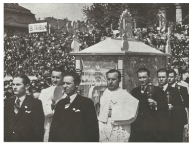
Elindul a frigysekrény

b) Az 1938-as dokumentumokból ránk maradt néhány fénykép, amelyeken jól látszik az első szentáldozásukhoz járuló gyermekek tömege, és a sok kis fehér ruha, amiben a Jézussal történő találkozásra készültek a fiatalok.