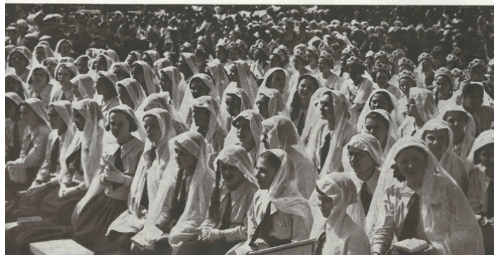
Az áhítat pillanatát előtt

Az élmény életre szóló volt minden áldozónak, és ehhez igazolásul valamennyien emléklapot kaptak. A következő feladatban tervezz egy olyan emléklapot, amely szerinted méltó lehetne a 2020-as kongresszuson elsőáldozáshoz járuló gyermekeknek emlékül. (Az emléklapot megtervezheted kézzel vagy számítógéppel is. A géppel elkészített emléklapot másold ide be a feladat utáni üres oldalra. A kézzel készített lapot pedig vagy fényképezd le és másold ide be, vagy melléketként csatold a feladatlapoddal együtt, ugyanazzal az elnevezéssel, amivel a dokumentumot beküldöd.)