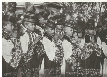
Imádkozó kis matyófiúk